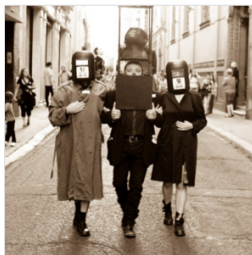
Museo de Arte Extemporáneo MAE

Miguel de todos los Migueles, de todos los vientos, de todos los pueblos, de todas las tierras, de todos los mundos.