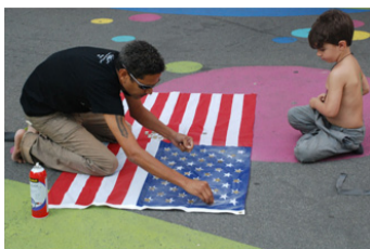
Supernova Festival, 2013 Rosslyn, Virginia.

Partiendo del episodio de la muerte del poeta Hernández, quiero hacer un funeral poético de un lingote de oro, ese oro histórico que tanto nos une y nos des-une.