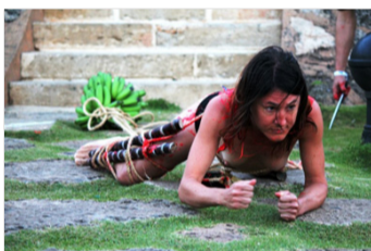
Fort San Felipe, 2013 Puerto Plata. República Dominicana.

¿De qué manera una condición o experiencia personal, como una enfermedad mental, interactúa con la estigmatización comercial y social del entorno?