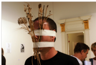
El hombre que quería ser poema, 2012. Centre de Lectura. Reus.

El ámbito en el que trabajo es la poesía experimental y, al igual que en la poesía visual y objetual, que también cultivo, en la acción poética todo es susceptible de convertirse en concepto, en símbolo o en palabra, en signo.